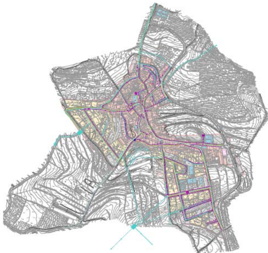
Figura. Estat actual del planejament a Ulldemolins

A continuació s'exposen les figures gràfiques dels models de l'estat actual del planejament a Ulldemolins, de la proposta de POUM de l'aprovació inicial i de la proposta de POUM d'Ulldemolins per a l'aprovació provisional.